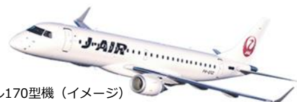
エンブラエル170型機（イメージ）

※赤枠内の経由便と直行便の所要時間を比較すると1時間20分～45分の短縮になります。